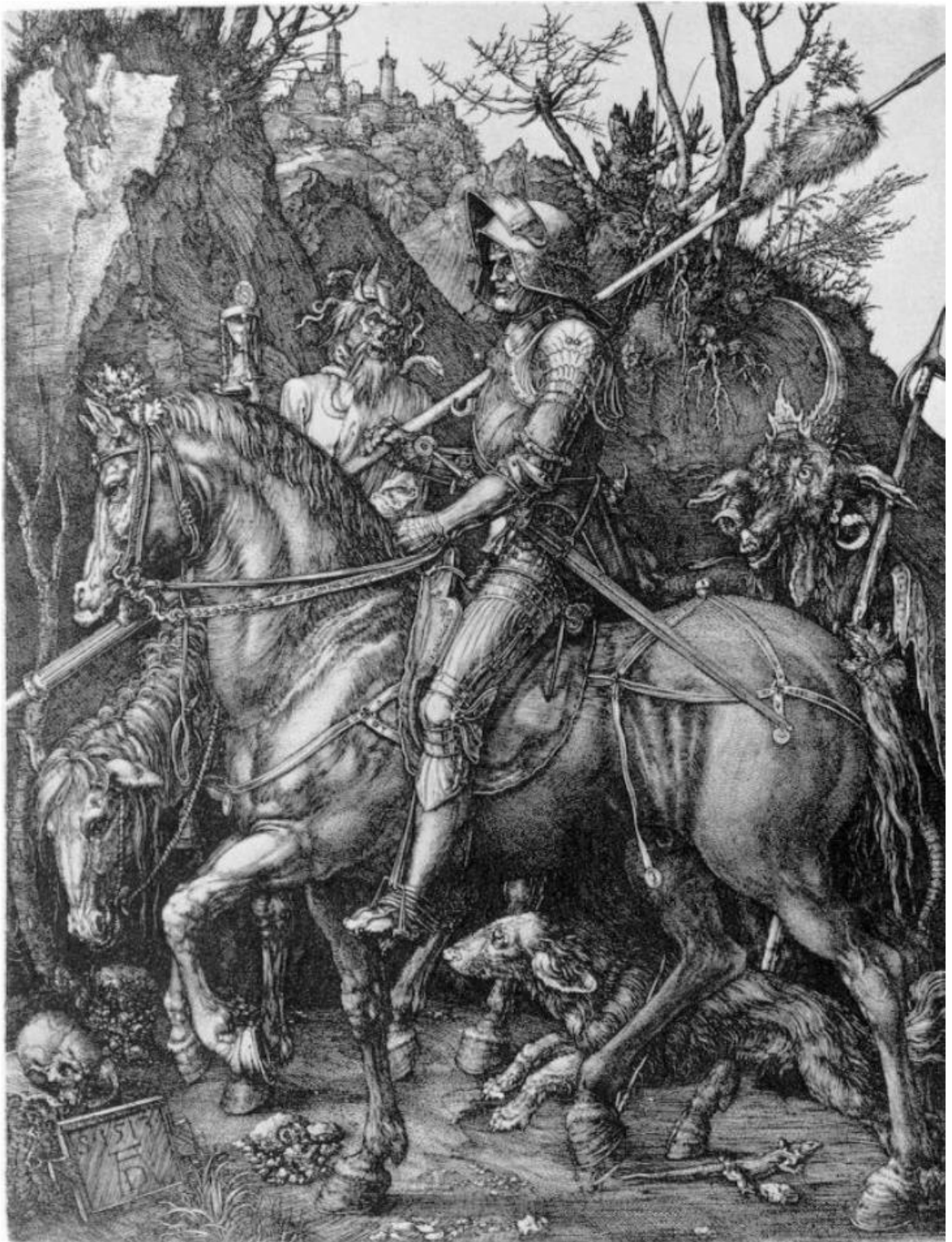
«Рыцарь, Смерть и Дьявол», гравюра Альбрехта Дюрера, Нюрнберг, 1513.